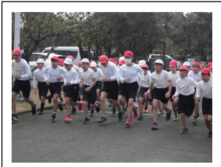
マラソン記録会 浜公園 (1/29)